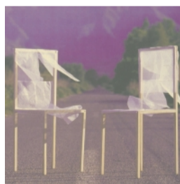
Laurie Litowitz's installation, Peace Spaces, USC Fisher