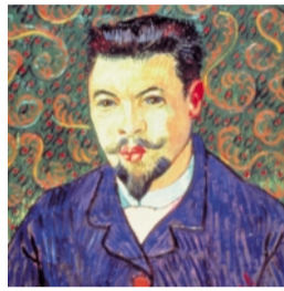
Van Gogh: Vincent Van Gogh Portrait of Doctor Rey, 1889 Oil on canvas The State Pushkin Museum of Fine Arts Moscow, Russia

Friday, September 19th • viernes 19 de septiembre 12:00PM Grand Performances at California Plaza FREE Admission • Entrada GRATIS